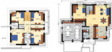
HOME REAL ESTATE