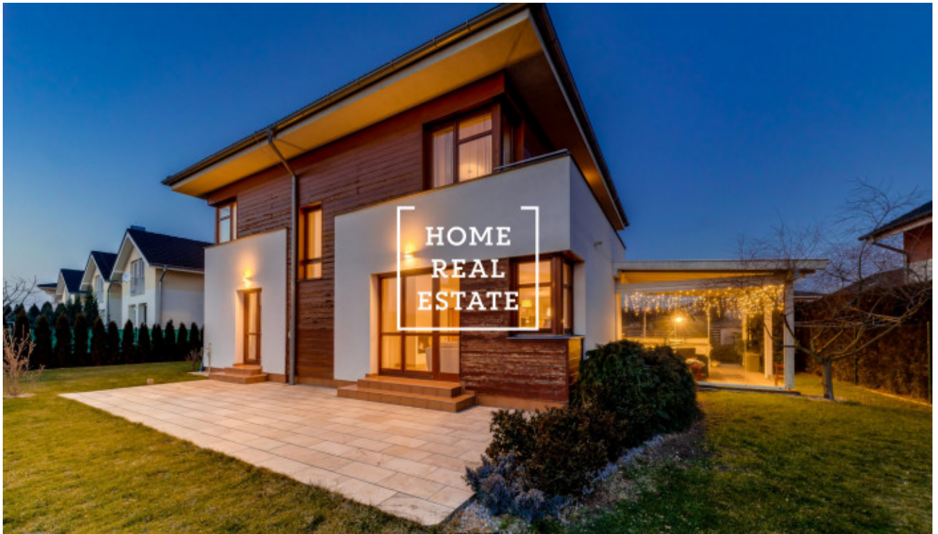
Kozáková 175/18, Praha - Pitkovice