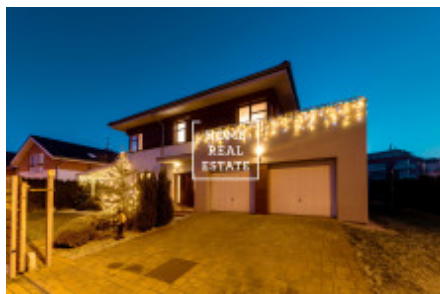
Kozáková 175/18, Praha - Pitkovice