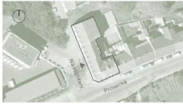
Lokalita - Prosecká 73/69

Prosecká vyhlídka je umístěna v nižší zástavbě navazující na starý Prosek nad Vydrošanami a nad Libní. Atmosféru místa dotváří krásné výhledy na vinice a panoramu Prahy a množství zeleně v okolí. Přímo za domem začíná lesopark Prosecké skály, nedaleko se nachází také oblíbená Prosecká vyhlídka, bobová dráha nebo Park přátelství o rozloze 11 hektarů.