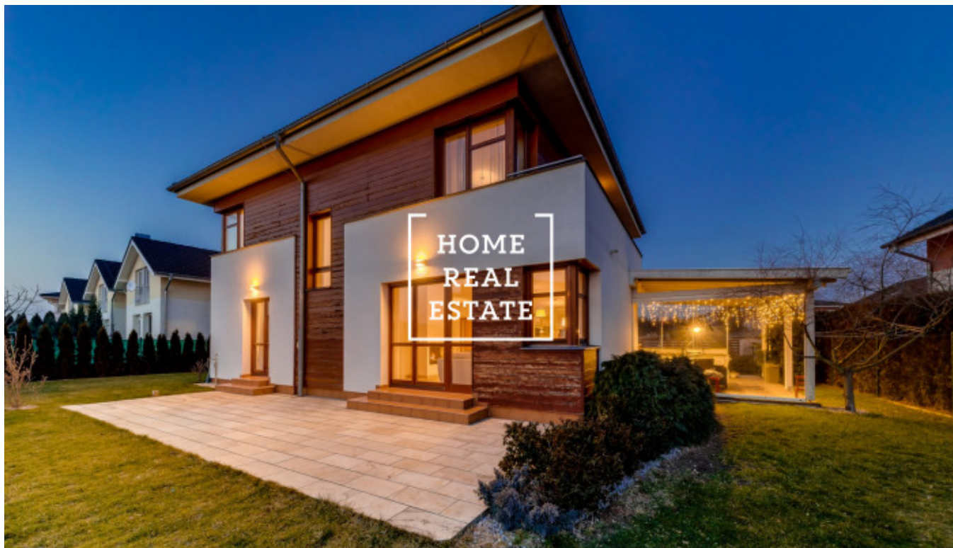
Kozáková 175/18, Praha - Pitkovice